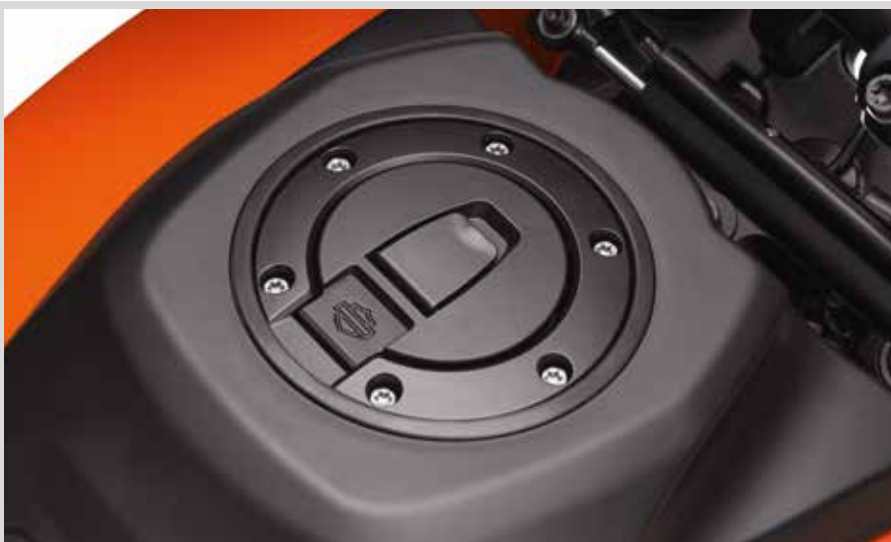
E. PAN AMERICA VERSCHLISSBARER RUNDER TANKDECKEL

Für RA1250 und RA1250S ab '21 und RA1250SE ab '24 mit Kupplungsdeckeln der Serienausstattung. Passt nicht zu Zubehör-Kupplungsmedaillons.