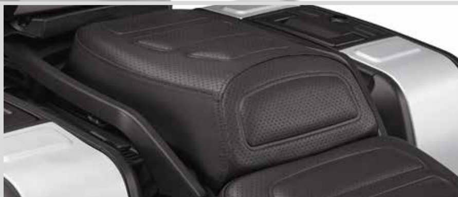
B. SUNDOWNER SOZIUSSITZ – PAN AMERICA

Für RA1250 und RA1250S Modelle ab '21 und RA1250SE Modelle mit Sundowner Solo Sitz P/N 52000478 ab '24.