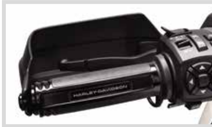
H. EMPIRE KOLLEKTION – BEHEIZTE LENKERGRIFFE