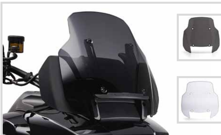
B. ADVENTURE WINDSCHUTZSCHEIBE – 11" DUNKEL GETÖNT