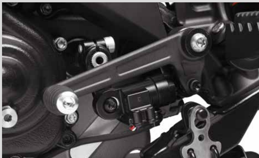
A. SCREAMIN' EAGLE QUICKSHIFTER FÜR PAN AMERICA 1250 MODELLE

Für California RA1250 und RA1250S Modelle '22-'23. Der Einbau erfordert ein Digital Technician Update vom Händler.