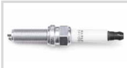
I. ORIGINALE HARLEY-DAVIDSON ZÜNDKERZEN