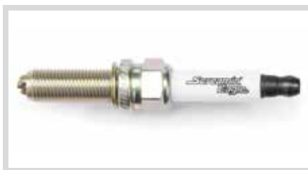
J. SCREAMIN' EAGLE PERFORMANCE ZÜNDKERZEN

31600190 Für Modelle ab '21 mit Revolution Max Motor.