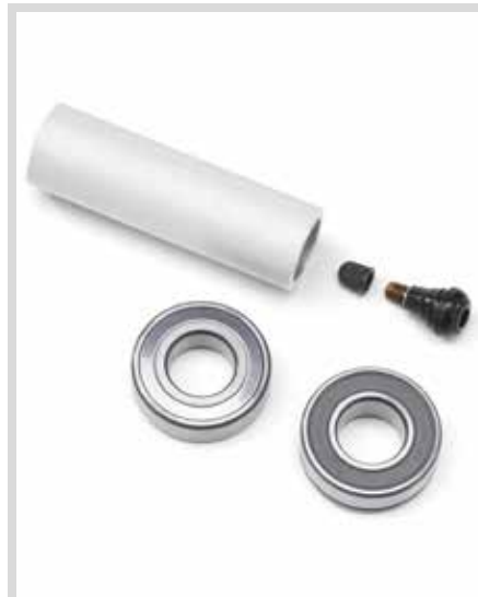
B. RAD-EINBAUKIT (ABS)

Für RA1250 und RA1250S Modelle ab '21 und RA1250SE Modelle ab '24.