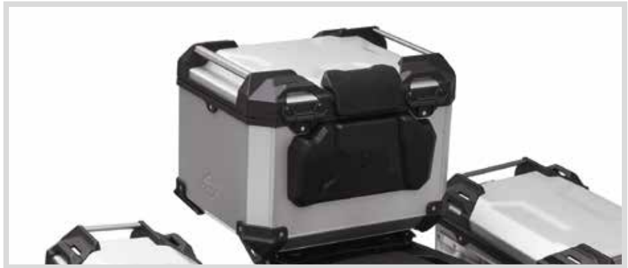
A. PAN AMERICA ALUMINIUM-TOP CASE – KLAR ELOXIERT

Für RA1250 und RA1250S Modelle ab '21. Erfordert Top-Case-Montagesystem P/N 53000800.