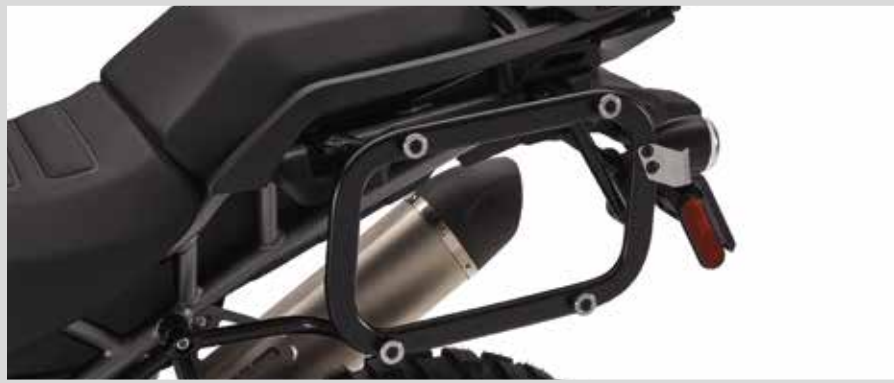
D. PAN AMERICA SEITENKOFFER-MONTAGESYSTEM