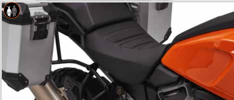
C. REACH SOLO SITZ – PAN AMERICA

Für RA1250, RA1250S ab '21 und RA1250SE Modelle ab '24.