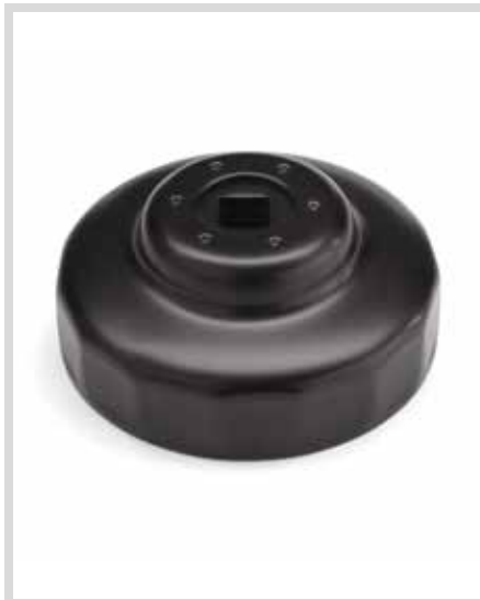
G. PAN AMERICA FILTERSCHLÜSSEL IN ENDKAPPENAUSFÜHRUNG