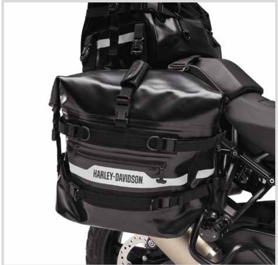
A. WEICHE PAN AMERICA ADVENTURE SATTELTASCHEN