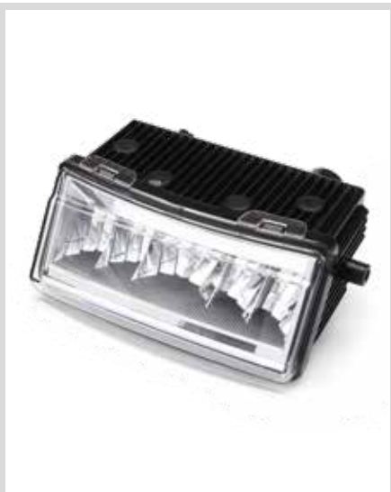
D. DAYMAKER LED-ZUSATZSCHEINWERFER