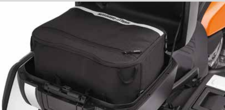
G. PAN AMERICA SPORT TOP-CASE-INNENTASCHEN