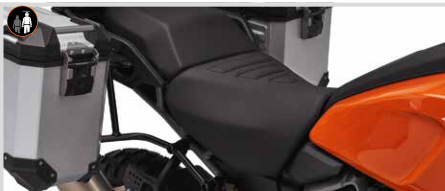
D. TALLBOY SOLO SITZ – PAN AMERICA

Für RA1250, RA1250S ab '21 und RA1250SE Modelle ab '24.