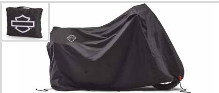
G. PREMIUM-ABDECKPLANE FÜR INNEN- UND AUSSENEINSATZ