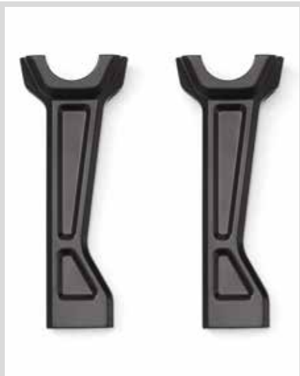
I. PAN AMERICA HOHE RISER