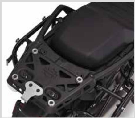
E. PAN AMERICA TOP-CASE-MONTAGESYSTEM