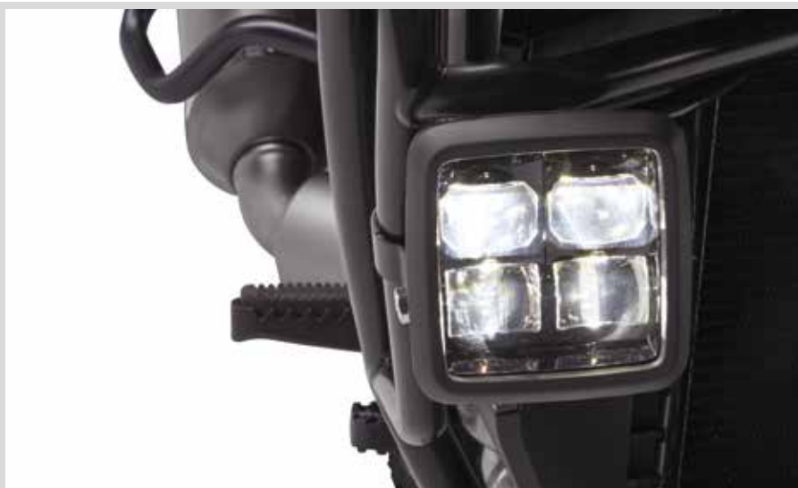
E. DAYMAKER LED-ZUSATZSCHEINWERFER

*HINWEIS: Manche gesetzlichen Bestimmungen verbieten Zusatzscheinwerfer bei Fernlichtscheinwerfern. Prüfen Sie vor dem Einbau die vor Ort geltenden Vorschriften.