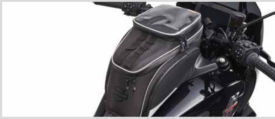
C. PAN AMERICA TANKTASCHE