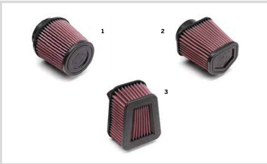
C. SCREAMIN' EAGLE LUFTFILTER

Für California '21, RA1250, RA1250S, RH1250 '21-'22 und RH975 Modelle '22.