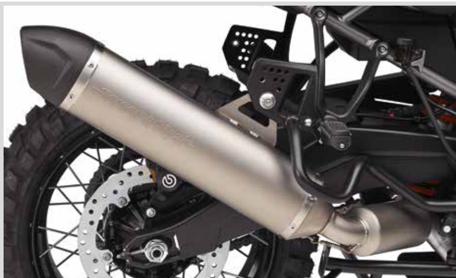
B. SCREAMIN' EAGLE STREET CANNON SCHALLDÄMPFER – PAN AMERICA

Für California RA1250 und RA1250S Modelle '22-'23. Der Einbau erfordert ein Digital Technician Update vom Händler.