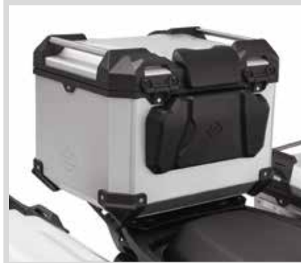
F. PAN AMERICA SOZIUSRÜCKENPOLSTER