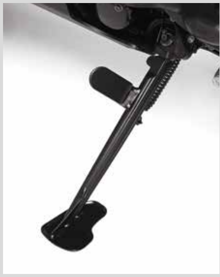
F. ADVENTURE SEITENSTÄNDER