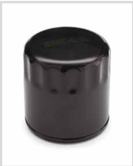
F. ORIGINAL HARLEY-DAVIDSON ÖLFILTER – SCHWARZ