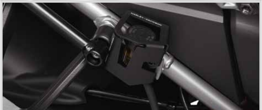
E. SCHUTZ DES HINTEREN BREMSFLÜSSIGKEITSBEHÄLTERS

Für RA1250 und RA1250S Modelle ab '21 und RA1250SE Modelle ab '24.