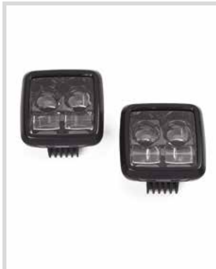
E. DAYMAKER LED-ZUSATZSCHEINWERFER