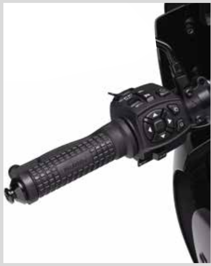
E. TACTICAL LENKERGRIFFE