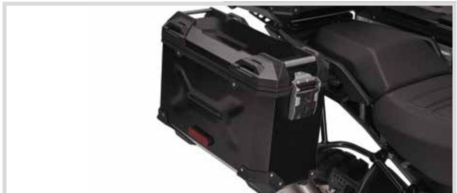
D. PAN AMERICA ALUMINIUM SEITENKOFFER – SCHWARZ

Für RA1250 und RA1250S Modelle ab '21. Erfordert Seitenkoffer-Befestigungssystem P/N 90202087.