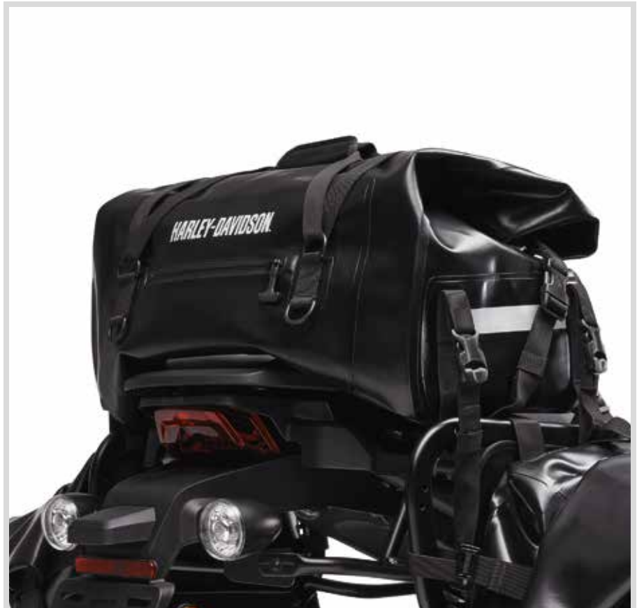
B. PAN AMERICA ADVENTURE REISETASCHE