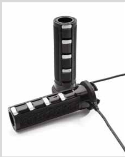
G. BEHEIZTE WILD ONE LENKERGRIFFE