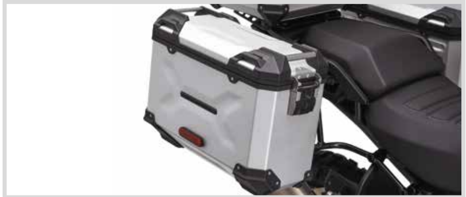
B. PAN AMERICA ALUMINIUM-SEITENKOFFER – KLAR ELOXIERT

Für RA1250 und RA1250S Modelle ab '21. Erfordert Seitenkoffer-Befestigungssystem P/N 90202087.