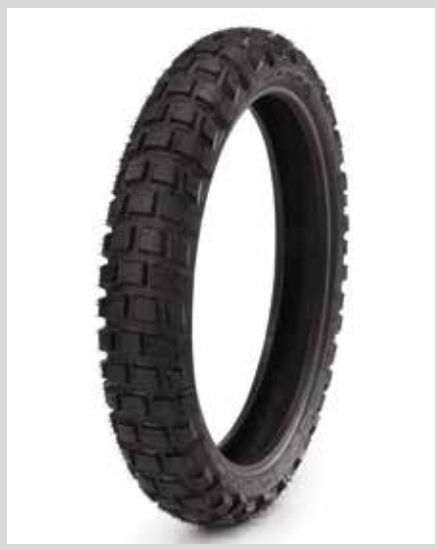
E. MICHELIN ANAKEE WILD – GELÄNDE-VORDERREIFEN