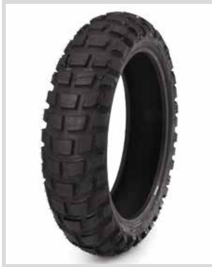
E. MICHELIN ANAKEE WILD – GELÄNDE-HINTERREIFEN