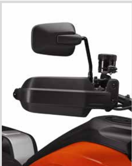
J. PAN AMERICA HAND-WINDABWEISER

Serienausstattung bei RA1250S und RA1250SE Modellen.