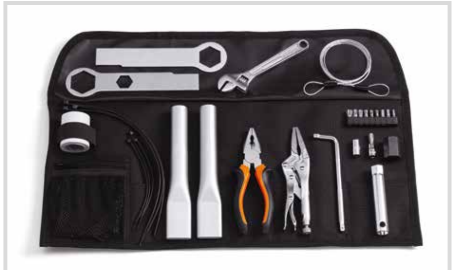
D. HARLEY-DAVIDSON WERKZEUG-KIT – PAN AMERICA

Zur Verwendung mit Revolution® Max Modellen ab '21.