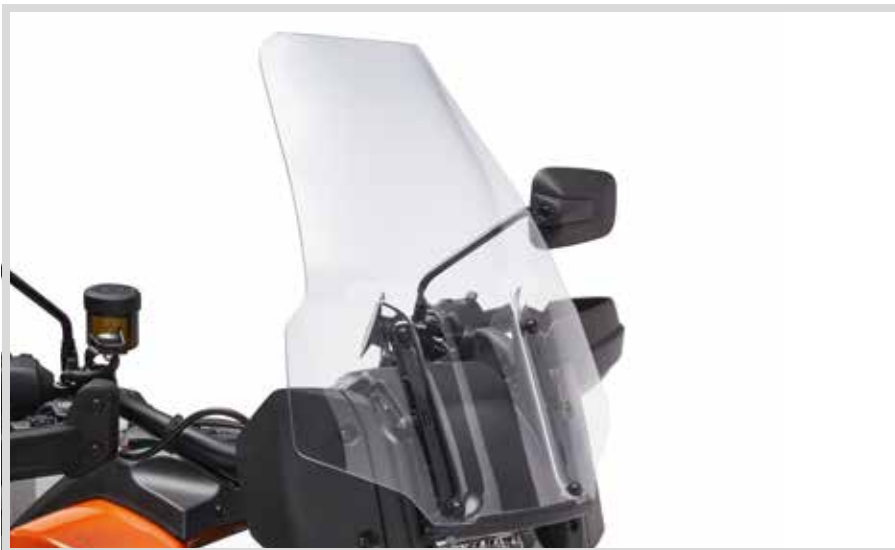
A. ADVENTURE WINDSCHUTZSCHEIBE – 18" KLAR

Entwickelt für RA1250 und RA1250S Modelle, aber auch für andere Kraftstofftanks geeignet. Kann einen Teil der Tankgrafik verdecken. Prüfen Sie das Erscheinungsbild vor Anbringung am Tank.