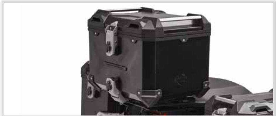
C. PAN AMERICA ALUMINIUM TOP CASE – SCHWARZ

Für RA1250 und RA1250S Modelle ab '21. Erfordert Top-Case-Montagesystem P/N 53000800.