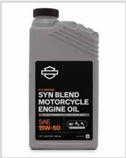
H. H-D ORIGINAL-SYN BLEND MOTORRADÖL