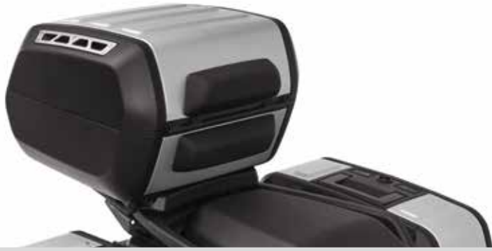
E. ABNEHMBARES PAN AMERICA SPORT TOP CASE