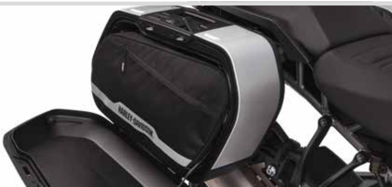
H. PAN AMERICA SPORT SEITENKOFFER-INNENTASCHEN