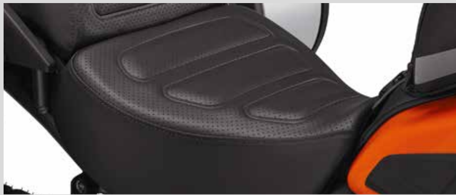
A. SUNDOWNER SOLO SITZ – PAN AMERICA

Für RA1250, RA1250S ab '21 und RA1250SE Modelle ab '24.