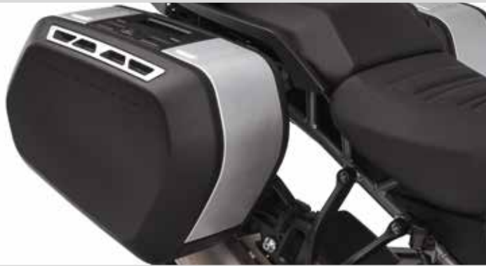
F. PAN AMERICA SPORT SEITENKOFFER