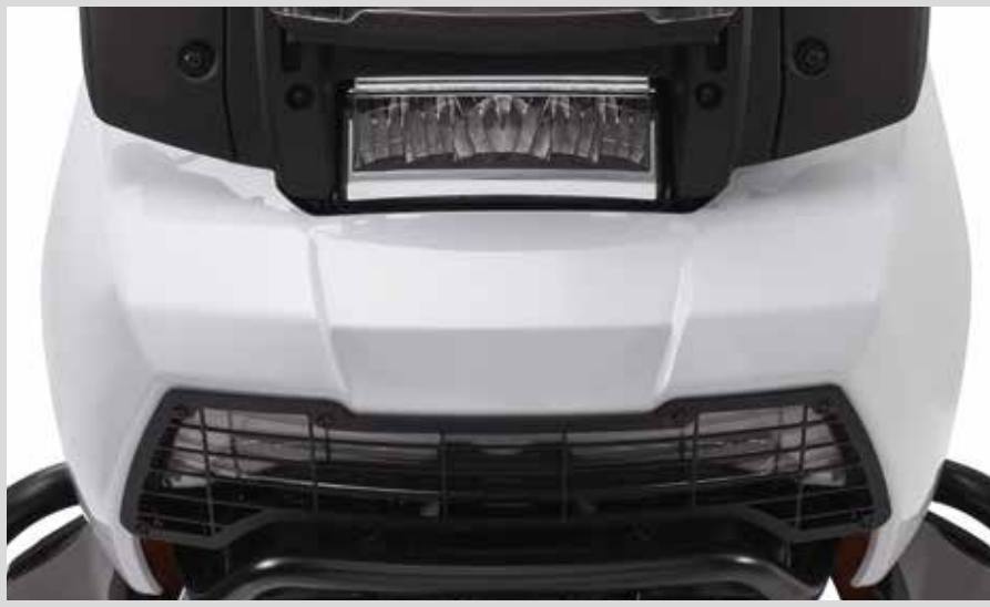
D. ADAPTIVER DAYMAKER SCHEINWERFER – UPGRADE-KIT