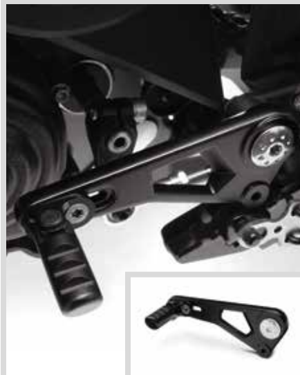
F. VERSTELLBARES OFFROAD-BREMSHEBEL-KIT