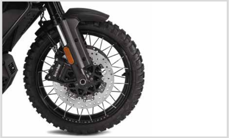
A. SPEICHENRAD – 19" VORN

Für RA1250 und RA1250S Modelle ab '21 und RA1250SE Modelle ab '24. Erfordert Rad-Einbauset P/N 42400039.