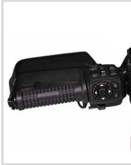
F. BEHEIZTE TACTICAL LENKERGRIFFE